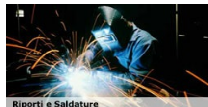
Riporti e Saldature